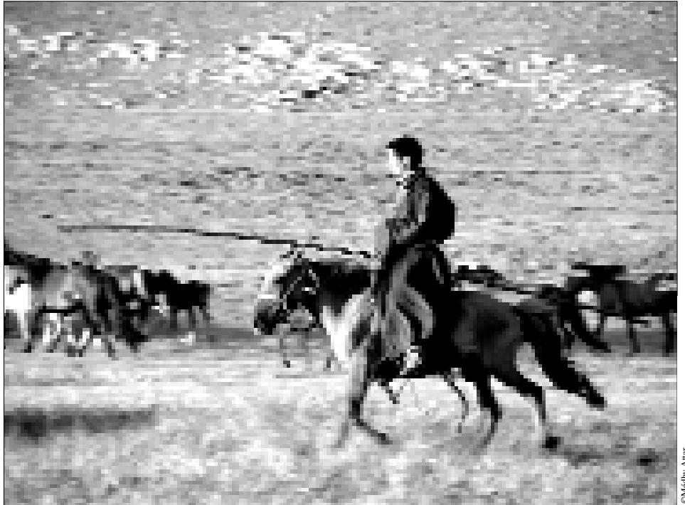
Maniement de l'urga, le lasso traditionnel

leux. Pour parvenir à cet état de paix intérieure, je me concentre sur les sensations de mes pieds et sur le mouvement de mon abdomen qui se gonfle à l'inspiration et se rétracte à l'expiration. L'air qui entre dans mes narines finit de m'apaiser. Au bout d'un temps