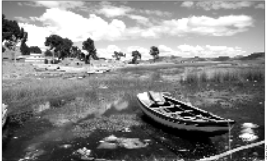
Sur les bords du lac Titicaca, juin 2006

l'image du président brésilien Lula qui est aujourd'hui empêtré dans des affaires de corruption. Et puis il subsiste dans certains cas la tentation d'acaparer ou de confisquer le pouvoir que ces grands leaders ont contribué à rendre au peuple dans un premier temps et que certains voudraient reprendre en